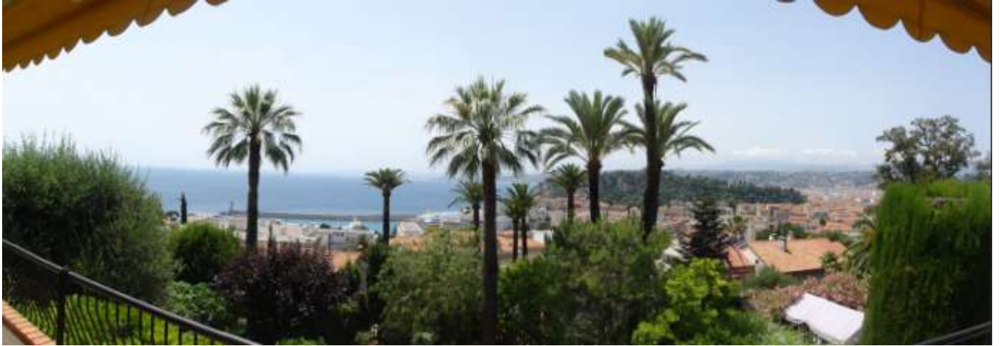
Vue d'ensemble (panoramique)

Mont-Boron (a 1 km por encima del puerto de Niza) en calle privada sin salida A 1 km de la playa "La Réserve", a 2,5 km del centro de la ciudad (Plz Masséna) Vistas sobre el mar, monte del Castillo y ciudad Alquiler por semanas para 6-8 personas