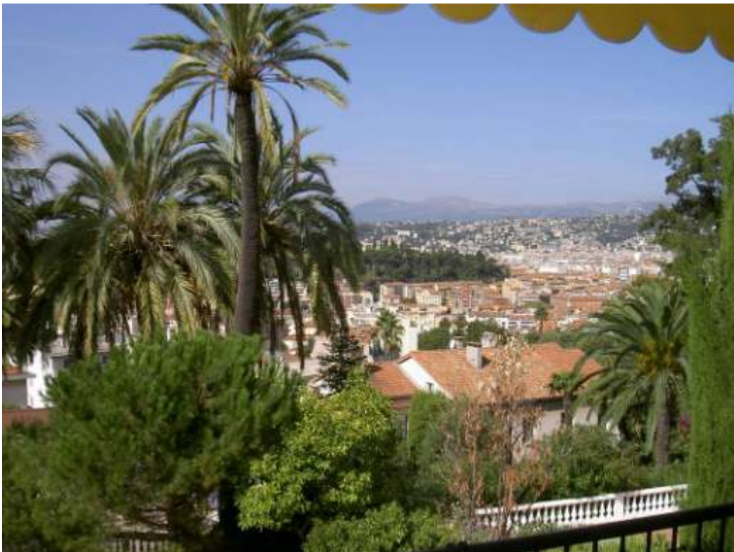
Vue à droite (sur le château, la ville et les montagnes)