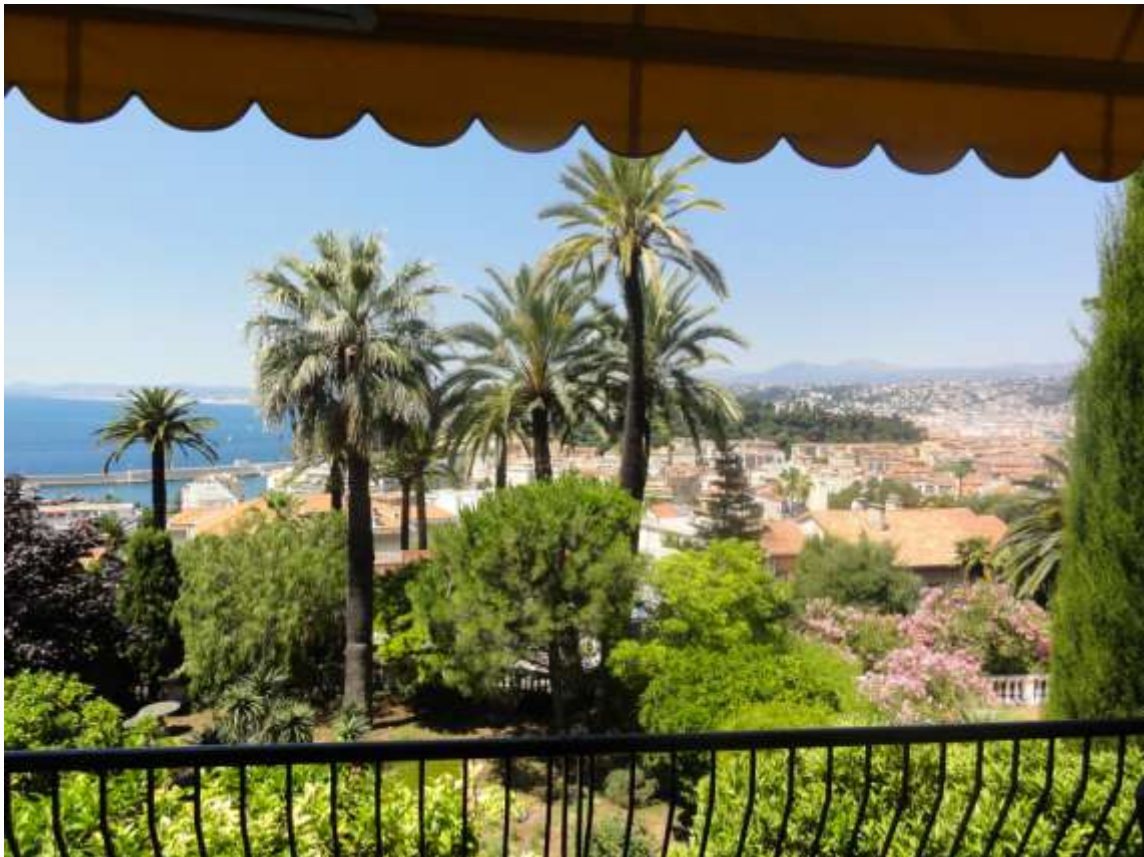
Vue centrale : sur le château