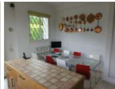
... o 8 personas

Otros equipamientos : Nevera con congelador (de 265 litros), horno piroclítico, horno microondas, lavavajillas, encimera con 4 fuegos eléctricos (vitrocerámica), campana, numerosos armarios y armarios empotrados, pica doble, encimera de trabajo doble (una junto a la cocina y otra en isla central) En la planta de garage : lavadora, fregadero y tendedero para secar la ropa ; aspirador