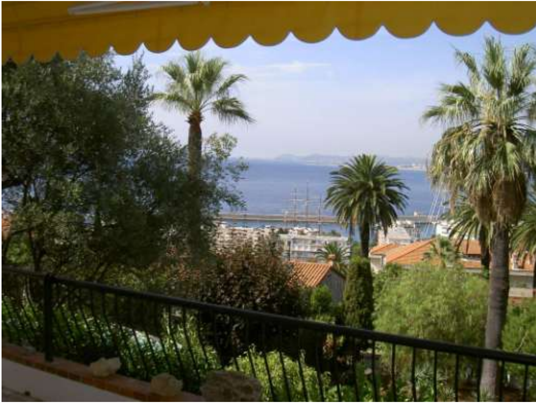
Vue à gauche (vers le cap d'Antibes)